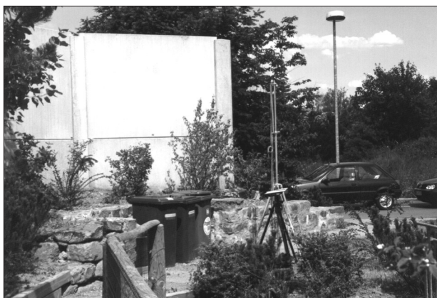
Bild 2: Fotografische Abbildung der Lärmschutzwand mit einem nach innen gerichteten Knick am nordöstlichen Wandende im Immissionspunkt IP4, nach [2].

Bild 3 stellt die gemessenen Pegel in Abhängigkeit von der Entfernung zur Wandmitte grafisch dar. Die durchgezogenen Kurven im Bild geben den durch eine polynomische Regressionsanalyse zweiten Grades bestimmten Verlauf der Meßwerte wieder. Dadurch, daß sich der Schall um die seitlichen Kanten des Schallschirmes beugt, steigt der Mittelungspegel (oben) um so stärker, je näher ein Immissionspunkt am Ende der Wand liegt. Am linken Ende der Lärmschutzwand trifft das nicht zu, da dort die Wand nicht plötzlich, sondern mit einem ca. 2 m langen Knick nach innen beendet wird, um dem gebeugten Schall entgegenzuwirken. Ähnliches stellt sich bei den Mittelungspegeldifferenzen (unten im Bild) ein. Danach ist die Pegeldifferenz am linken Rand größer als am rechten Ende der Wand. Die Messungen haben ergeben, daß durch diese Maßnahme eine Pegelmin-